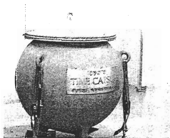
Fig. 1 Time Capsule in the clean room

収納品は5000年後を目指し当時の技術を結集しての保存が考えられた。タイム・カプセル本体容器の材質は特殊ステンレス鋼(NTK-22AT)が用いられている。これはオーステナイト組織のみからなり、加工による \alpha 相析出がない。また含有炭素量を極力少なくし、チタンを添加することにより長年の炭素拡散による結晶変態を防止しようとした合金である。カプセル本体成分を Table 2 に示す。これを特殊反転鑄造法により極力加工せず球状(つぼ型)に一体成型し、Ir 192 の \gamma 線による欠陥検査を行った。ふたの密封については、樹脂パッキングでは炭素拡散による \alpha 相の析出、金属パッキングも拡散による粒界腐食が考えられ、ま